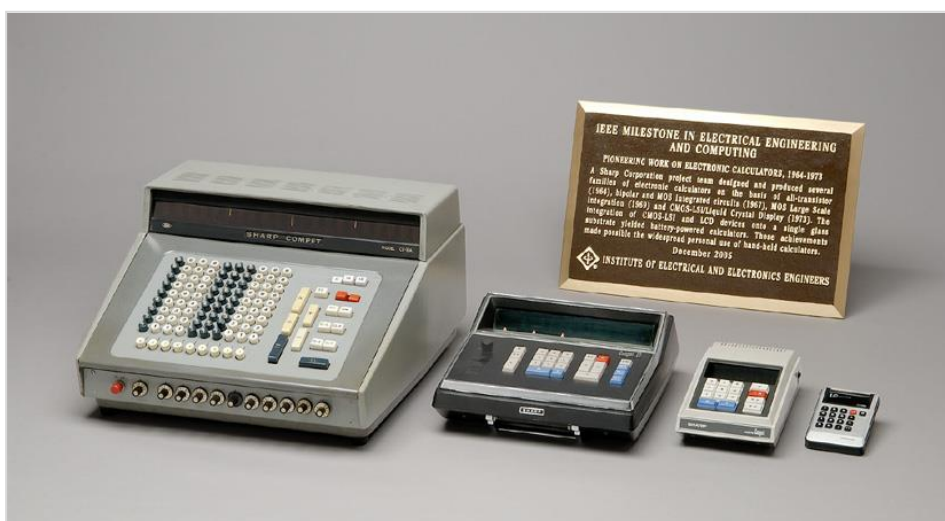
การเริ่มต้นคิดค้นเครื่องคิดเลขอิเล็กทรอนิกส์ (พ.ศ. 2548)

กิจกรรมดังกล่าวตลอดหลายปีที่ผ่านมาได้รับการยอมรับจากสถาบันต่างๆ ทั่วโลก รวมถึง IEEE 1 ซึ่งเป็นสมาคม สถาบันวิศวกรรมไฟฟ้า อิเล็กทรอนิกส์ สารสนเทศ และโทรคมนาคมที่ใหญ่ที่สุดในโลก โดยยกย่องให้การพัฒนาทั้งสาม อย่างของชาร์ปเป็นหลักไมล์ของ IEEE 2 ได้แก่ “การเริ่มต้นคิดค้นเครื่องคิดเลขอิเล็กทรอนิกส์”, “การทำธุรกิจและการผลิต แผงโซลาร์เซลล์ในระดับอุตสาหกรรม” และ “จอภาพแอลซีดีแบบ TFT (TFT-LCD) ขนาด 14 นิ้วสำหรับทีวี”