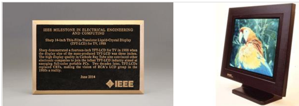
จอภาพแอลซีดีแบบ TFT (TFT-LCD) ขนาด 14 นิ้วสำหรับทีวี (พ.ศ. 2557)

*1 IEEE คือ สมาคมสถาบันวิศวกรไฟฟ้าและอิเล็กทรอนิกส์ระดับนานาชาติที่ไม่แสวงหาผลกำไรที่ใหญ่ที่สุดในโลก โดยมีสำนักงานใหญ่อยู่ที่สหรัฐอเมริกา มีสมาชิกกว่า 409,000 รายทั่วโลก IEEE มีบทบาทสำคัญทางด้านเทคนิคตั้งแต่วิศวกรรมคอมพิวเตอร์ อิเล็กทรอนิกส์ และโทรคมนาคม ไปจนถึงพลังงานไฟฟ้า วิศวกรรมการบินและอวกาศ และเทคโนโลยีชีวการแพทย์